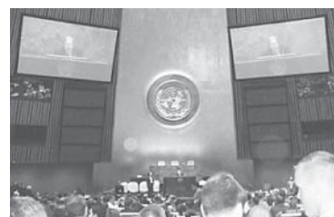
第19回模擬国連会議全日本大会