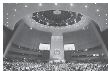
模擬国連会議全米大会 第28代日本代表団派遣事業

皆様も当日は会議の様子を是非ご覧下さるようお願いいたします。追ってご案内申し上げます。