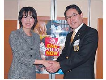
財団学友 宇宙飛行士 山崎直子さんと (学友会主催クリスマス会にて)