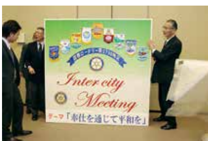
お見送り 看板を次年度ホストクラブへ引継ぎ