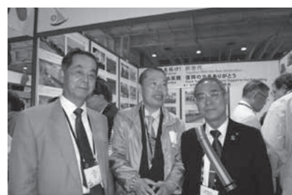
各国、各団体より多数のブースが出展されていました