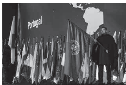
開会本会議でのフラッグセレモニー 168 の国と地域から参加がありました