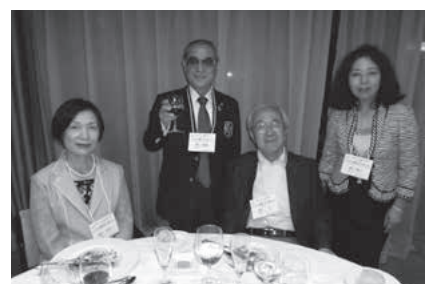
2013 千葉ナイトで主催の得居直前ガバナーとご一緒に