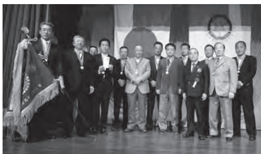
優勝の成田コスモポリタンRC

2014年度の野球リーグ参加チームを募集しています。 個人(1名より)での参加も可能ですので、お気軽に下記連絡先にお問い合わせください。