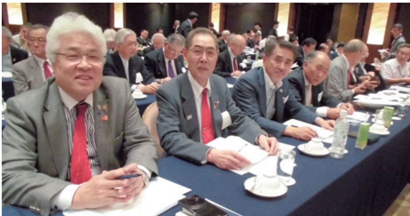
ロータリー財団地域セミナーにて

公式訪問の真ただ中にある。連日県内各クラブを訪れ、皆様の温かいおもてなしに紙面を通じ感謝、御礼申し上げます。既に84クラブの2/3を終え終盤にさしかかりました。スタートした頃と比べると、出来る限り直接皆様とお話し致そうとの気持ちから、皆様とのフリートーク時間が徐々に増し、生の声で、本音で、話すことを意識する様になりました。