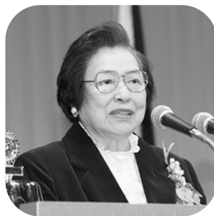
堂本暁子千葉県知事