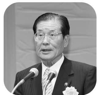
荒木勇習志野市長