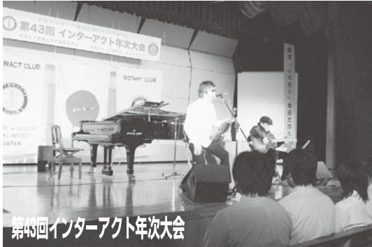
第43回インターアクト年次大会