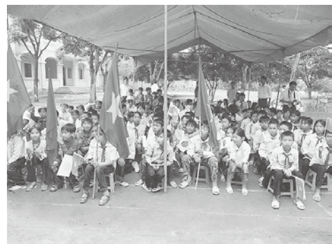
教材支援先のハノイ郊外ポップチェン小学校の歓迎風景