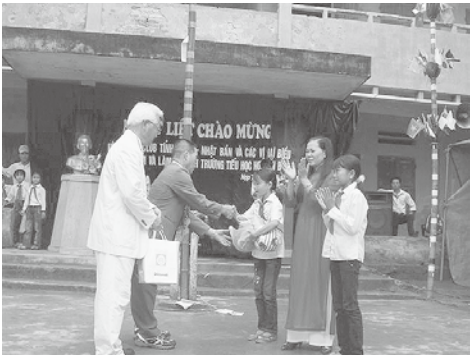
ベトナムの小学校へ球技用具の進呈

世界の中で文字の読み書きが出来ない人口比率は、2000年調査によると1億3000万人にものぼり、3分の2の少女が読み書きが出来ないという実態であります。世界後発開発途上国で、非織字者の多い国として、アフリカ諸国・東南アジア諸国などが挙げられます。一例を挙げますと、タイの少数民族などは読み書きが出来ないために就職が出来ない、仕事を探すために都会に出ても、最終的には麻薬の運搬人になったり、少女たちは強制的に売春を強制されたりすることもあり、その為エイズに感染して、国に帰った先の部落中がエイズに汚染されるという悲しい現状があります。職を持たない人たちは生活が出来ないために犯罪に走る傾向が大であります。犯罪に走るのを防ぐ方法としては、職を持たせるようにWCS活動を通して支援をすることが先決で妥当だと思います。今年度はフィリピン、ベトナム、ミャンマー、カンボジア等から支援プロジェクトが届いております。支援には援助資金が必要です。千葉県83クラブのロータリークラブの会員の皆様から協力援助金を提供していただければ支援が出来ます。今年度も半年が経過いたしました。早急な対応が必要だと思われれます。各クラブにプロジェクト内容をご連絡いたしましたので、支援協力を頂けるクラブがございましたらご早急にご連絡をしていただきたいと思います。RI地区奉仕プロジェクト委員会WCS小委員会から、皆様の温かいご支援のお願いを申し上げます。