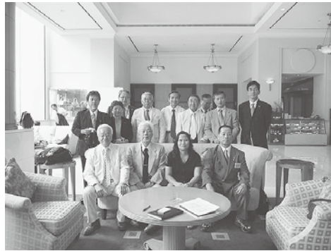
2年連続の教材支援にWCS宿泊先まで表敬訪問された ハノイ人民委員会ダナン局長(下右から2番目)を囲んで