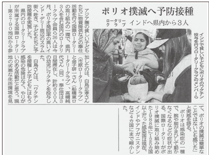
千葉日報(2010年1月24日)にて掲載されました。