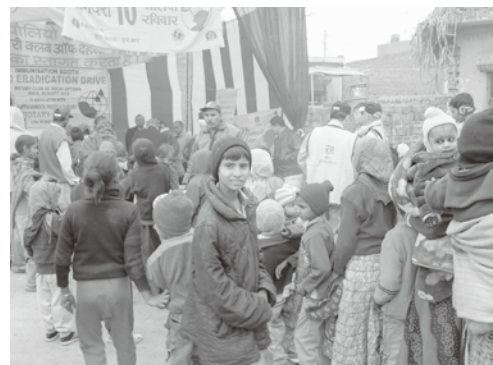
インド・ポリオワクチン投与活動風景