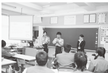
全日本空輸株式会社:客室乗務員の機内サービスと安全装置及び機体の整備点検、荷物の取り扱いなどを説明するスタッフ。