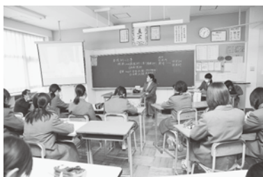
看護師:初期治療の重要性、健康・衛生など、日常の健康管理についてアドバイスをしながら、看護の現場を画像で説明している様子。