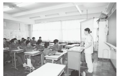
理学療法士:身体に障害を持つ方が、基本的な運動能力の回復を目的としてリハビリテーション器具、装置を用いて治療を行う。日頃の運動が大切と説かれた。