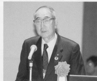
講演「ロータリーの進化について」