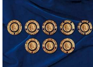
マルチプル・ポール・ハリス・フェロー