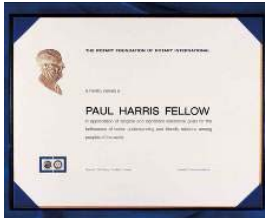
ポール・ハリス・フェロー