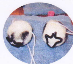
どう見ても牛には見えませんでした