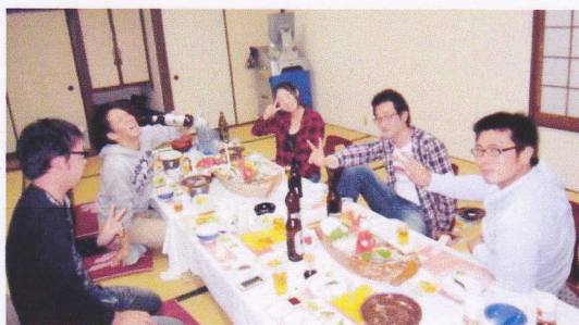
幸田旅館での懇親会