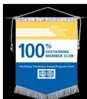
100%「財団の友」会員クラブ