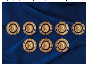
マルチプル・ポール・ハリス・フェロー