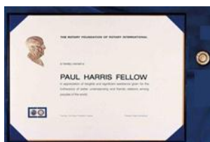
ポール・ハリス・フェロー