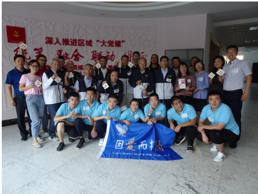
子供たち・元米山奨学生・会員の全員写真