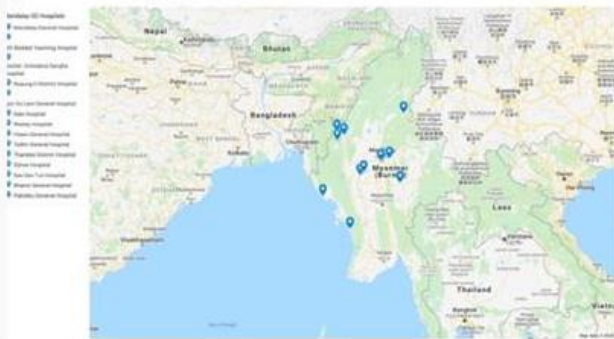
spitals to Which the Equipments Will Be Distributed