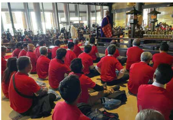
昨年成田山新勝寺で行われたポリオデーの様子