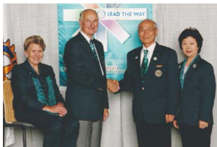
2006-07年度 ウィリアムB.ボイドRI会長夫妻 (ニュージーランド)と記念撮影