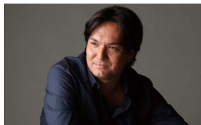
ジョン・健・ヌッツォ プロフィール

アメリカ国籍のテノール歌手、東京都出身。1966年5月5日生まれ。父はイタリア系アメリカ人、母は日本人。南カリフォルニア・チャップマン大学音楽部声楽科卒業。2000年に世界三大歌劇場の一つであるウィーン国立歌劇場でデビューし、新進歌手に贈られるオーストリア芸術新人大賞「エバーハルト・ヴェヒター・メダル」を受賞。NHK大河ドラマ「新選組!」のテーマ曲を歌い、NHK「紅白歌合戦」に2度出場。上皇上皇后陛下とローマ教皇に歌声を披露した経験をもつほか、MLBやサッカーの国際試合での国歌斉唱もつとめた。これまで世界的な名歌手と共演、国内外の数多くのオーケストラへ客演するなど、類まれな声とテクニック、幅広いパートリーで聴衆を魅了している。