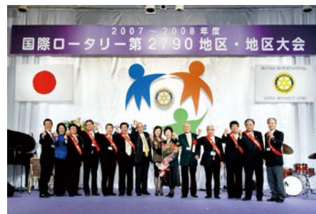
藤川RI会長代理夫妻と地区幹事団の面々