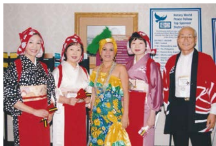
オテモヤン・サンバの衣装と ブラジルのご夫人