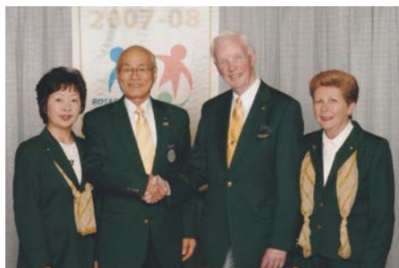
2007-08年度 ウィルフリッドJ.ウィルキンソンRI夫妻と 記念撮影