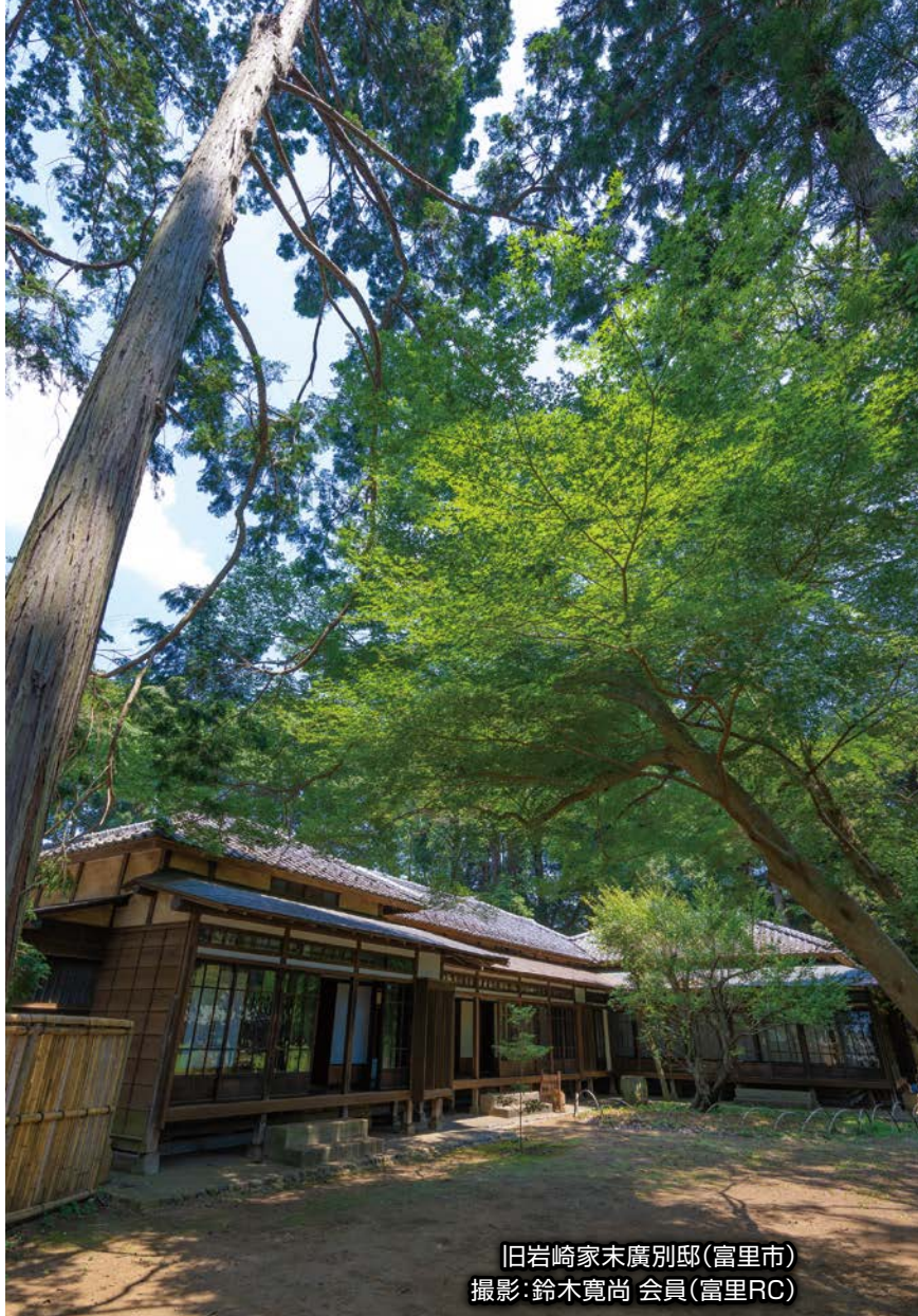
旧岩崎家末廣別邸(富里市)

To Club Presidents Secretaries in District 2790 (CHIBA)