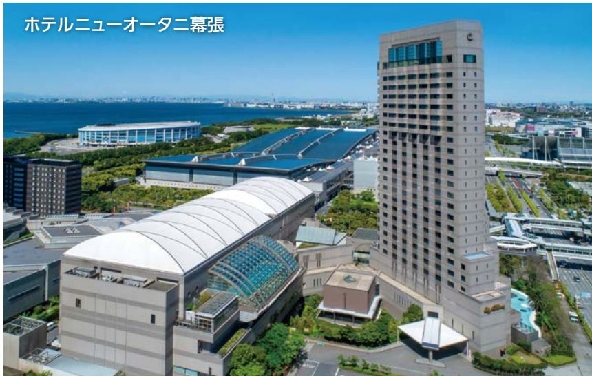
ホテルニューオータニ幕張