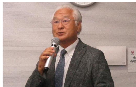
富一美 奨学生学友委員