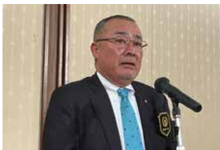
ガバナー補佐 中山浩一