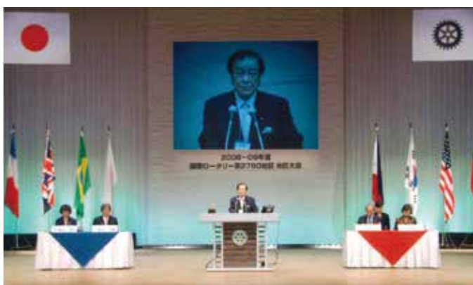
地区大会の思い出