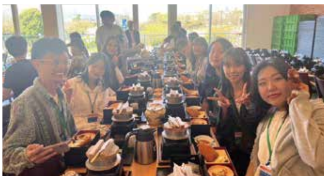
1日目 伊豆フルーツパーク昼食