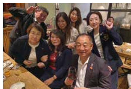
インフォーマルミーティング