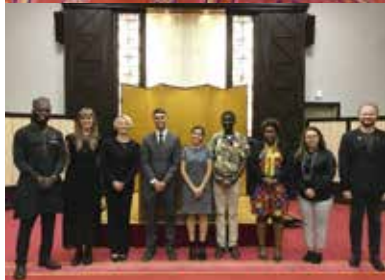
【第22期ロータリー平和フェロー9名】

歓迎パーティーにおいて平和フェロー9名による自己紹介スピーチが、習いたての日本語で行われま