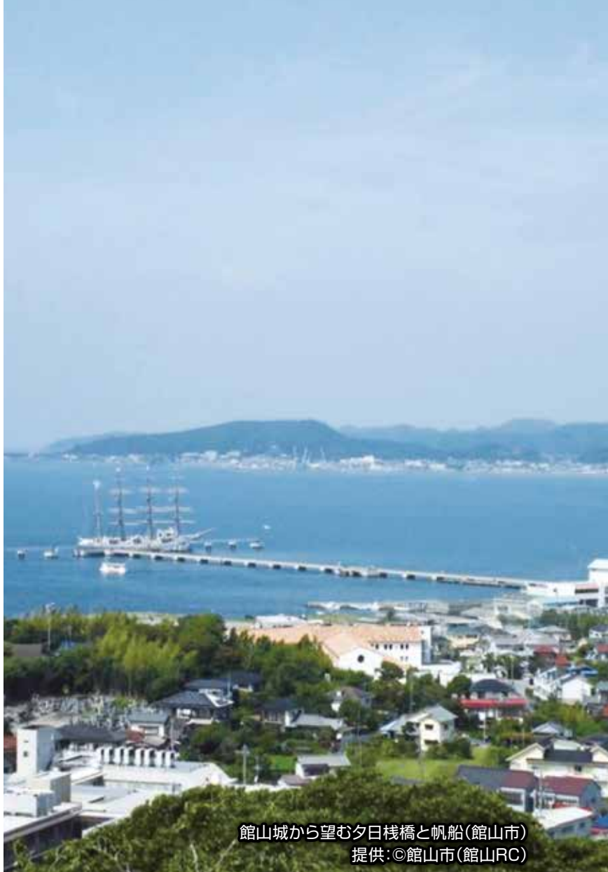
館山城から望む夕日桟橋と帆船(館山市)

To Club Presidents Secretaries in District 2790 (CHIBA)