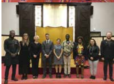
【第22期ロータリー平和フェロー9名】

歓迎パーティーにおいて平和フェロー9名による自己紹介スピーチが、習いたての日本語で行われま