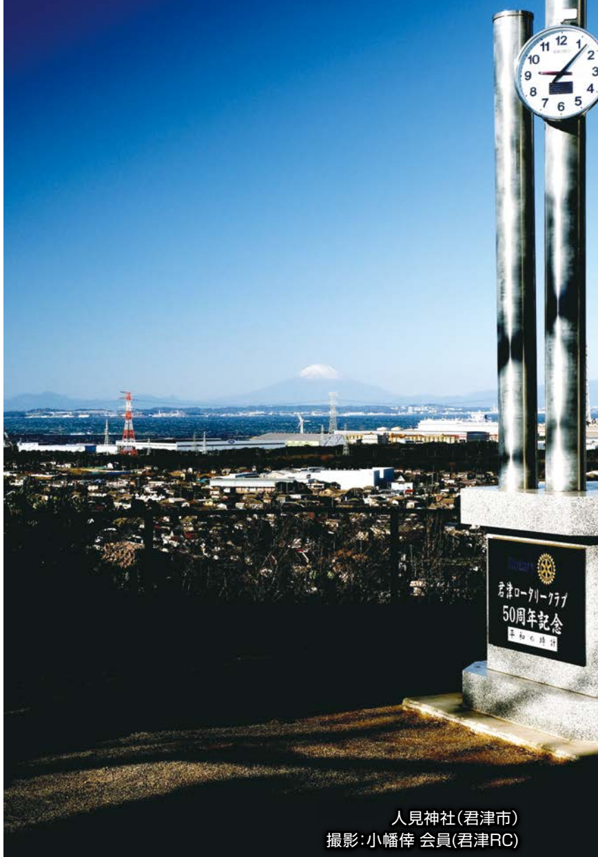
人見神社(君津市)

To Club Presidents Secretaries in District 2790 (CHIBA)