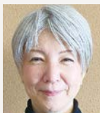
城臺 彩衣 (富津中央RC) カフェ オーナー 1月2日