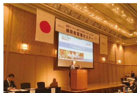
地区補助金管理セミナー