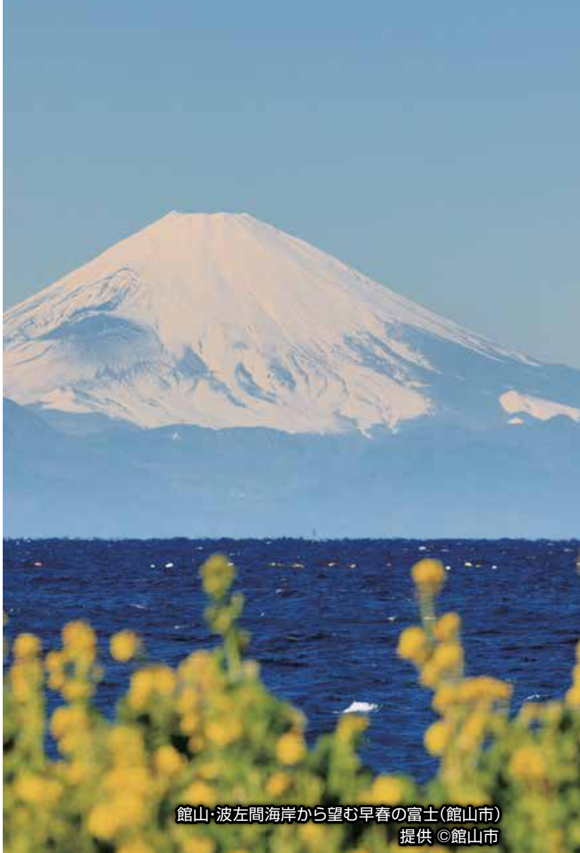
館山・波左間海岸から望む早春の富士(館山市)

To Club Presidents Secretaries in District 2790 (CHIBA)