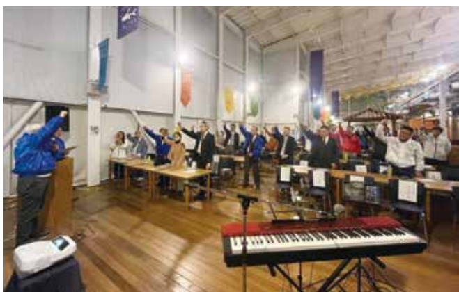
「鋸山を日本遺産へ」応援コール