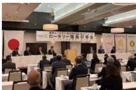
パネルディスカッション テーマ「ロータリーは楽しいですか」 第10グループ 各クラブ会長