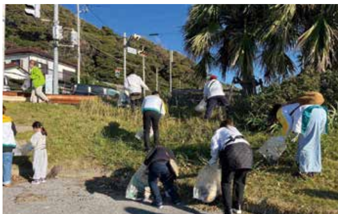
鋸山の麓、金谷港他 環境クリーン活動

た活動内容や今後の展望を共有する機会をつくり、地域として取り組む「鋸山を日本遺産へ」の認知を広げて、多くの方と「鋸山」の魅力を再発見する応援プロジェクトを計画。無事終了しました。