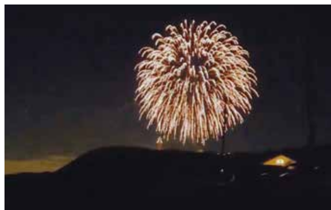
花火打ち上げ 東京湾観音地先 憩いの里ブルーベリー園 於