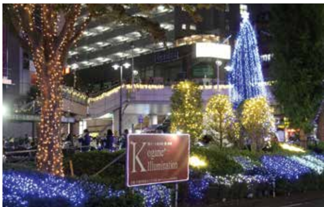
イルミネーション