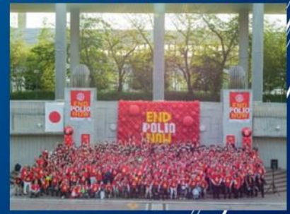
昨年成田空港で行われたポリオデーの様子