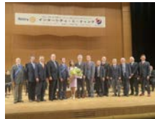
講演後 第5グループの 記念写真