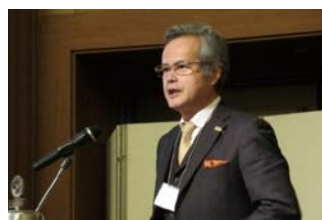
時田ガバナーノミニー