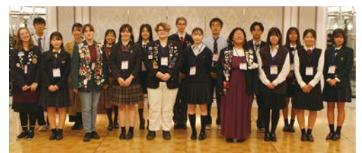
青少年交換コース