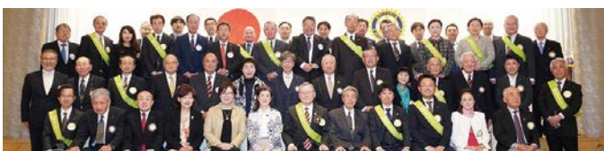
第8グループ（4クラブ）集合写真

これまで築き上げてきたものをどう次世代につないだら良いのか、そのヒントを頂き、大変勉強になったIMであったと思っております。