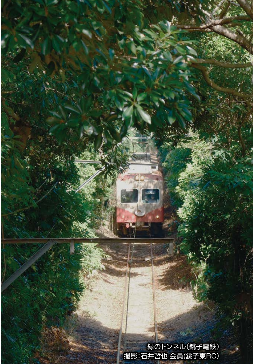
緑のトンネル(銚子電鉄)