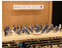
日本製鉄君津 吹奏楽団による スプリングコンサート