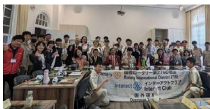
インターアクト国外研修