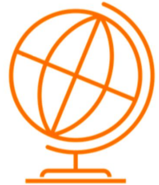
地域適応力 Regional Adaptability

シンプルで明確な目標設定と達成までの検証、そしてロータリーの優先事項との整合性をとることで今まで以上の成果が期待できます