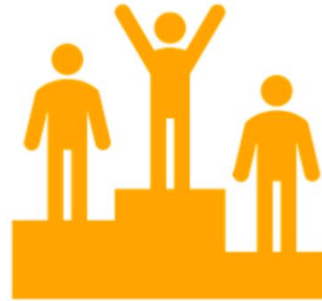
シンプルさと整合性 Simplicity & Alignment

シンプルで明確な目標設定と達成までの検証、そしてロータリーの優先事項との整合性をとることで今まで以上の成果が期待できます