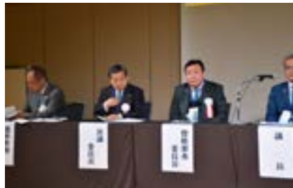
地区大会委員会報告の様子