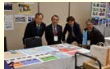
奉仕プロジェクト統括委員会