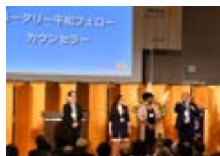
ロータリー平和フェロー