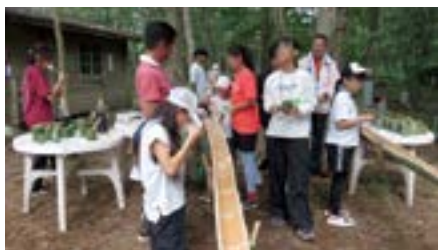
流しそうめんの様子

なお、この「てらこやちば」と当クラブとの連携が評価され、「ちばコラボ大賞 (千葉県知事賞)」を受賞するという成果にもつながりました。今後も環境保全・青少年教育・国際理解の3要素を兼ね備えた奉仕活動として継続し、地域とともに歩む持続可能なクラブ運営を目指してまいります。