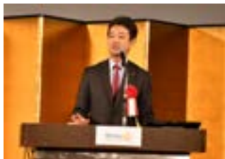
熊谷俊人千葉県知事