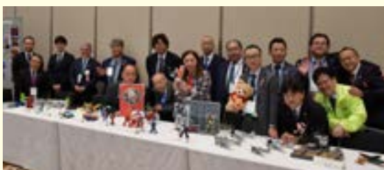
プラモデル同好会