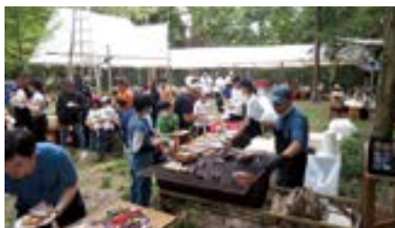
バーベキューの様子