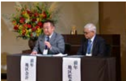
2024-25 年度地区収支報告・監査報告の様子