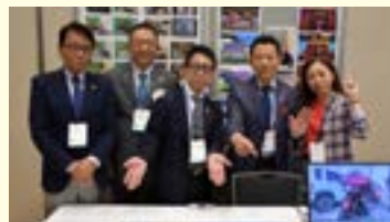
フェローシップ・親睦活動委員