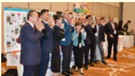
ロータリー米山記念奨学事業