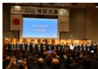
米山記念奨学生・米山学友会