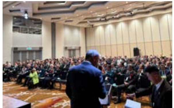
大会 1 日目の様子