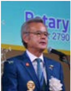
時田清次ガバナー

本会議 1 日目は、地区内クラブ会長に承認を求める議案 (2024-25 年度会計収支報告、地区大会決議案) は承認され、また 2024-25 年度において顕著な功績のありましたクラブは表彰され、感謝状を手渡されました。