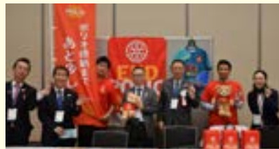
ロータリーポリオプラス委員会