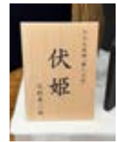
八犬伝 展示 「伏姫」 辻村寿三郎作