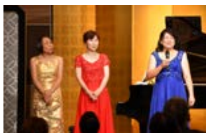
ロータリー財団学友による演奏