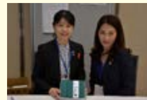
青少年プロジェクト統括委員会