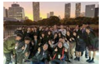
東京湾浜離宮前（屋形船）