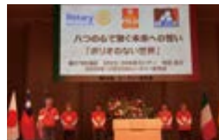
ポリオデー活動報告

最後にロータリー研究会に参加をしてみて、いかに第 2790 地区がポリオ根絶に熱い思いを持っているかを身に染みて感じました。これも常日頃から、ご理解ご協力をしてくださっている県内ロータリアンの皆様の御心の賜物です。