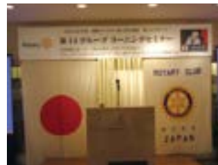
14G ラーニングセミナー