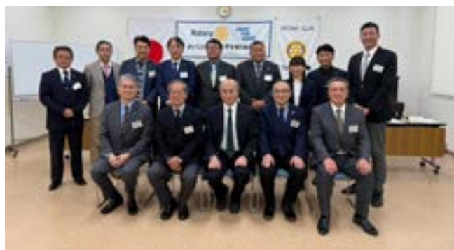
第9グループ会長・幹事ガバナー補佐・補佐幹事・平塚理念委員長

参加いただいた各クラブ会長を始め会員の皆さまには御礼を申し上げます。御協力有難う御座いました。