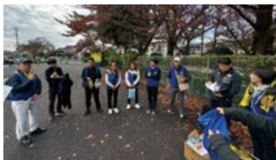
開始前ミーティング

本事業の実施にあたり、ご協力いただいた柏RC会員、柏市職員、柏レイソル関係者の皆さまに心より感謝申し上げます。