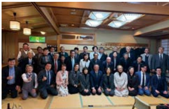
パートシリーズ修了 卒業式・懇親会