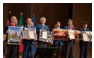
フォトコンテスト受賞