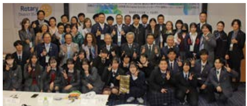
インターアクターとロータリアン集合写真