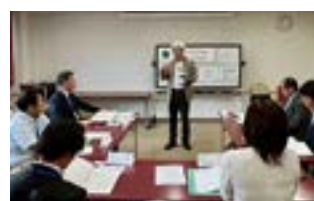
研修風景 江上 FT