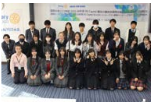
インターアクター集合写真