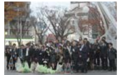
千葉市内清掃活動