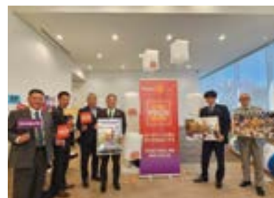
フォトコンテスト受賞者