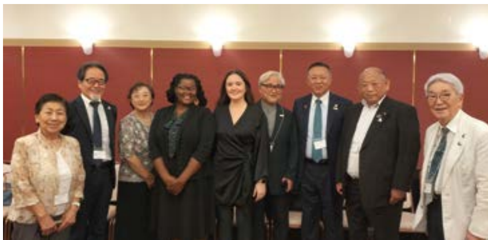
平和フェローオリエンテーション第2790地区出席の皆様