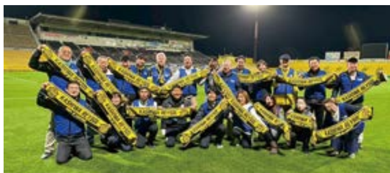
ピッチ体験終了後の柏RCメンバー