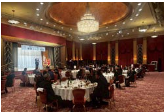
2025 年野球リーグ納会の様子