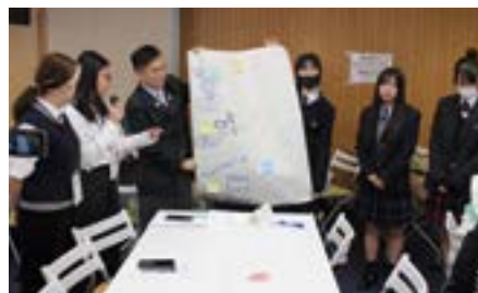
グループワーク発表