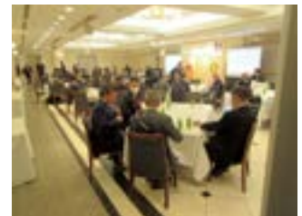
テーブルディスカッション