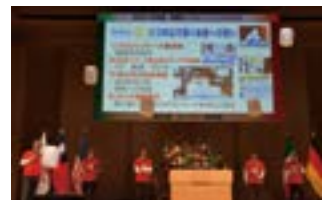
壇上でランタンを上げる