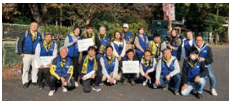
集合場所へ誘導後の柏RCメンバー