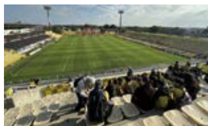
子どもたちの観戦風景