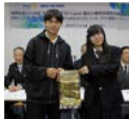
日台インターアクト代表

2 日間で急遽体調をくずして不参加の生徒も数名いましたが無事に終了することが出来ました。参加していただいた両国ロータリアン、ローターアクト、米山学友の皆様の協力に深く感謝し、心より御礼申し上げます。