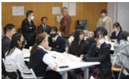
グループワーク風景