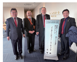
西那須野 RC 参加者の皆様