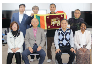
新スタジオでの集合写真