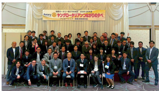
60名を超える参加者の皆様 誠にありがとうございました!