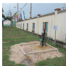
手押し井戸ポンプ