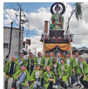
米山奨学生・随行ロータリアン・佐原 RC 会員