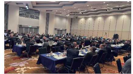
ディスカッションの様子