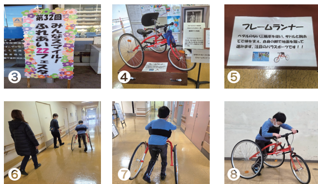
①ふれあい22施設内花壇 花の植え替え作業後 有志にて ②フレームランナーを前に「みんなスマイル!ふれあい22フェスタ」開催前 ③令和7年12月6日第32回障害者週間記念事業「みんなスマイル!ふれあい22フェスタ」参加 ④フレームランナー贈呈後の展示 ⑤フレームランナーの説明 ⑥⑦⑧ふれあい22施設内 フレームランナーにてリハビリ中