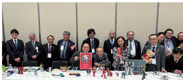
プラモデル同好会 地区大会友愛の広場での集合写真

です。いろいろなことを企画して自分が参加したいと思えるものに参加する“自由さ”や“気楽さ”があっ ていいと思っています。プラモデルが出来ようが出来まいがこの際関係なく、人がやっているのを見ているだけのメンバーもいます。「居心地のよい居場所づくり」が目的であるプラモデル同好会にあなたの居場所は必ずあります。見学も自由に行っていますので是非一度ご参加ください。お待ちしております！