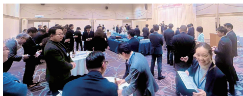
名刺交換・交流タイム