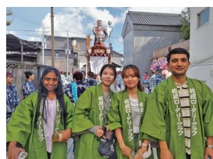
体験に参加された4名の米山奨学生