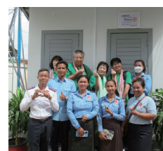
教師達と記念写真