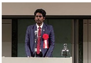
スリランカでの災害支援の講演の様子