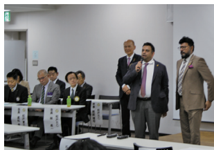
スリランカビジネス評議会

金を医療へ再投入するという、多角的な一面も紹介いただいた。あまりにも大きな事業のため、とてもこの文面だけでは、収まりません。自分ではどうしようもない、「極度の貧困」の連鎖を断ち切る。そのチャンスを作り出すこと。「行動なくして、何も生まれない」「不条理と戦って、人が人を助け合える」。そういう世界こそが、「平和の良い世界」と、様々な言葉が胸に突き刺さる、印象に残るIMでした。関係者の皆様、ありがとうございました。