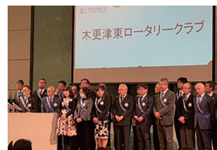
クラブ紹介の様子