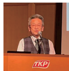
大塚奨学生・学友委員長の説明