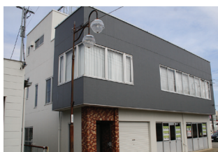
新スタジオの外観