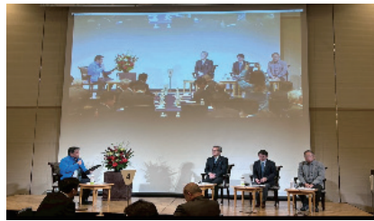
トークセッションの様子