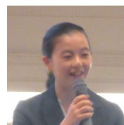
關(せき)まり子財団学友