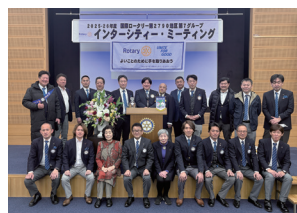
茂原中央 RC 参加者