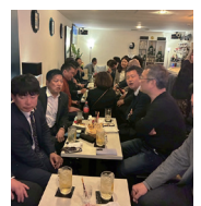
2次会も盛況でした!