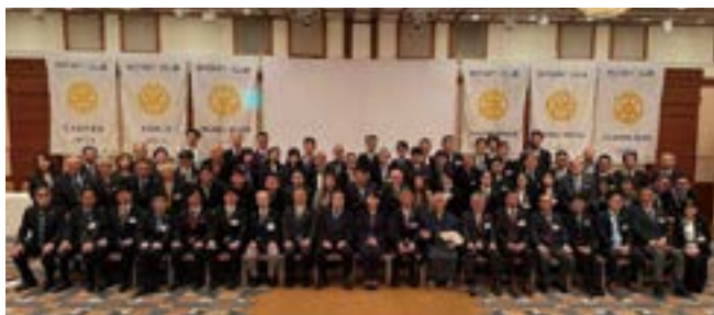
第11グループ集合写真