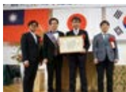
姉妹クラブの小学生書画交流事業に長年の功績に対して千葉市立検見川小学校へ感謝状の授与

この三つの育成事業を通じて、青少年に「夢と希望を与え」そして、千葉西ロータリークラブとして『浪漫』を追求する一年にしたいという思いで、本年度をスタートさせて頂きました。一つ目の昨年 12 月 21 日に開催した「仲間と紡ぐこどもたちの夢ジョイントコンサート」は、総勢 175 名の子供達の全力の演奏会でした。二つ目は、当クラブ 10 周年記念事業、既に 40 年間に渡る長年の実績を誇る「公益信託千葉西ロータリークラブ青少年育英基金」の更なる拡充です。三つ目も継続事業となる「社会福祉法