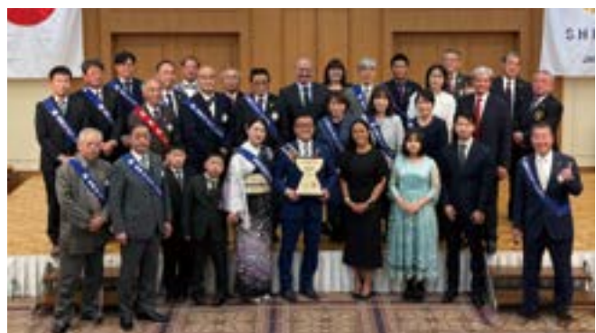
白井RC・タモンベイRC・そのご家族との集合写真