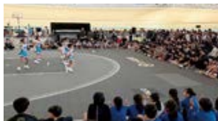
チアリーディングが華を添えた