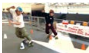
スケートボードの日本代表デモ