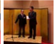
前ガバナー補佐への御礼