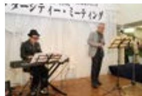
懇親会でのミニコンサート