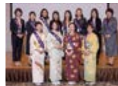
女性会員集合写真