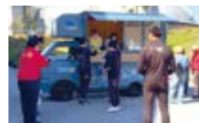
初披露した千葉 RC キッチンカー