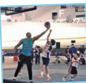
プロ選手との交流会