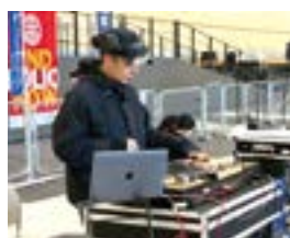
会場を盛り上げた DJ