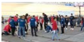
メンバーによる会場設営