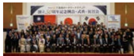
台湾高雄北区 RC・韓国釜山鎮 RC・千葉西 RC 姉妹クラブ 集合写真

人千葉いのちの電話」を通して、未来を担う若者の自死防止への地道な支援活動の更なる充実です。