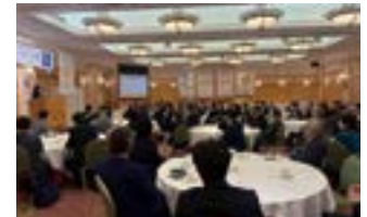
会長エレクト発表の様子