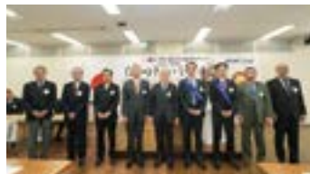
上総次年度ガバナー補佐と会長幹事の皆様