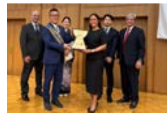
タモンベイRCから御祝いの盾