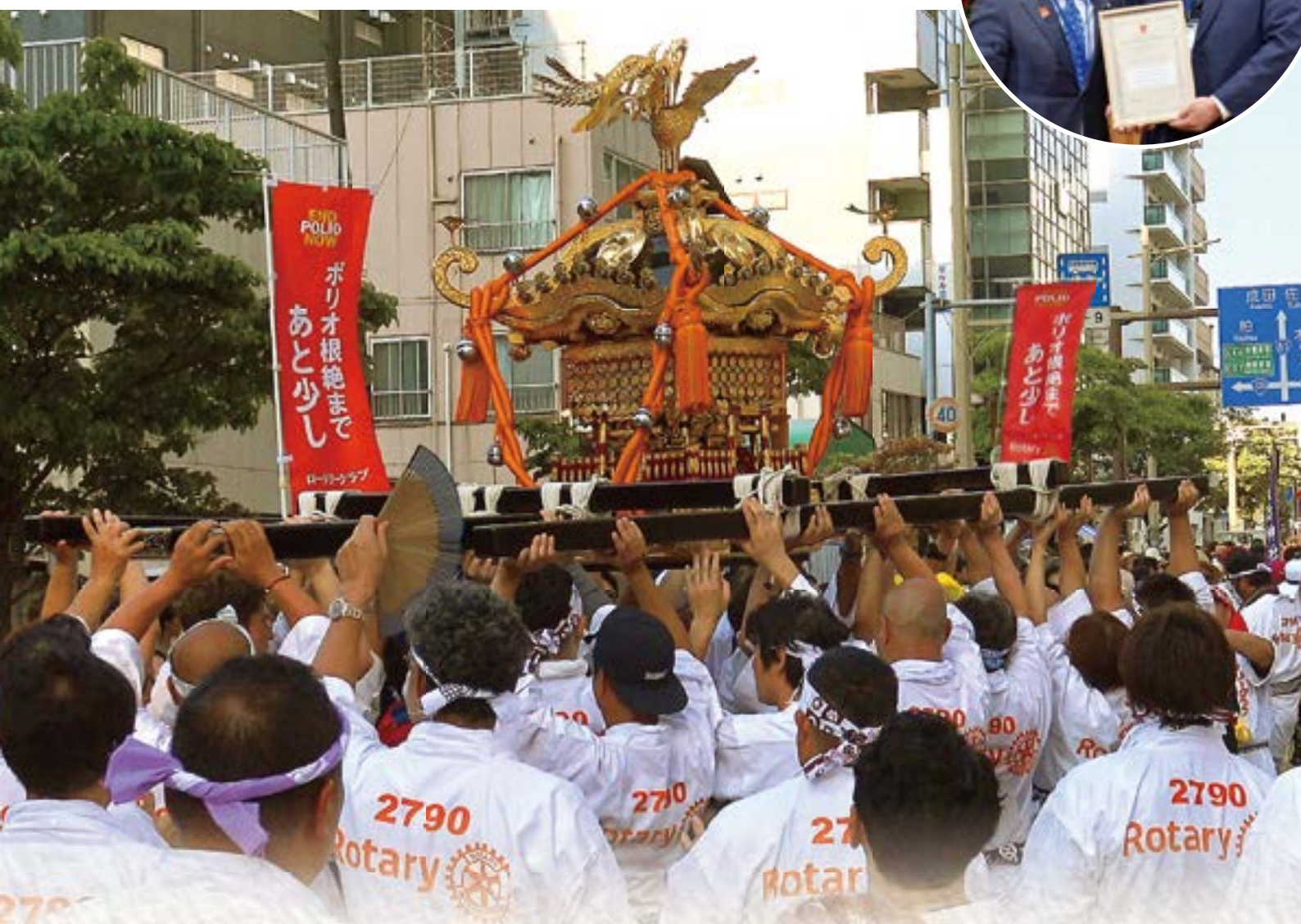
四宮R | 理事エレクト賞 受賞写真