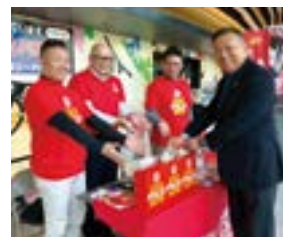
地区ロータリーポリオプラス委員会