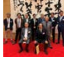
小見川 RC 参加者