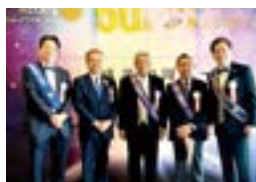
海寶勸一 50 周年記念事業式典祝賀推進委員長を囲んで