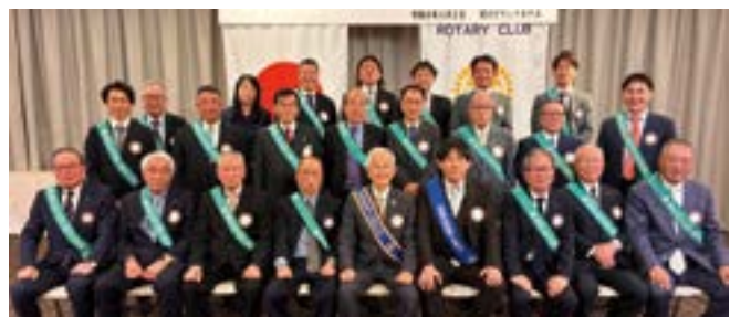
市川シビックロータリークラブ35周年記念式典参加会員