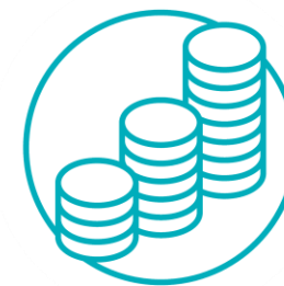
地域社会の経済発展