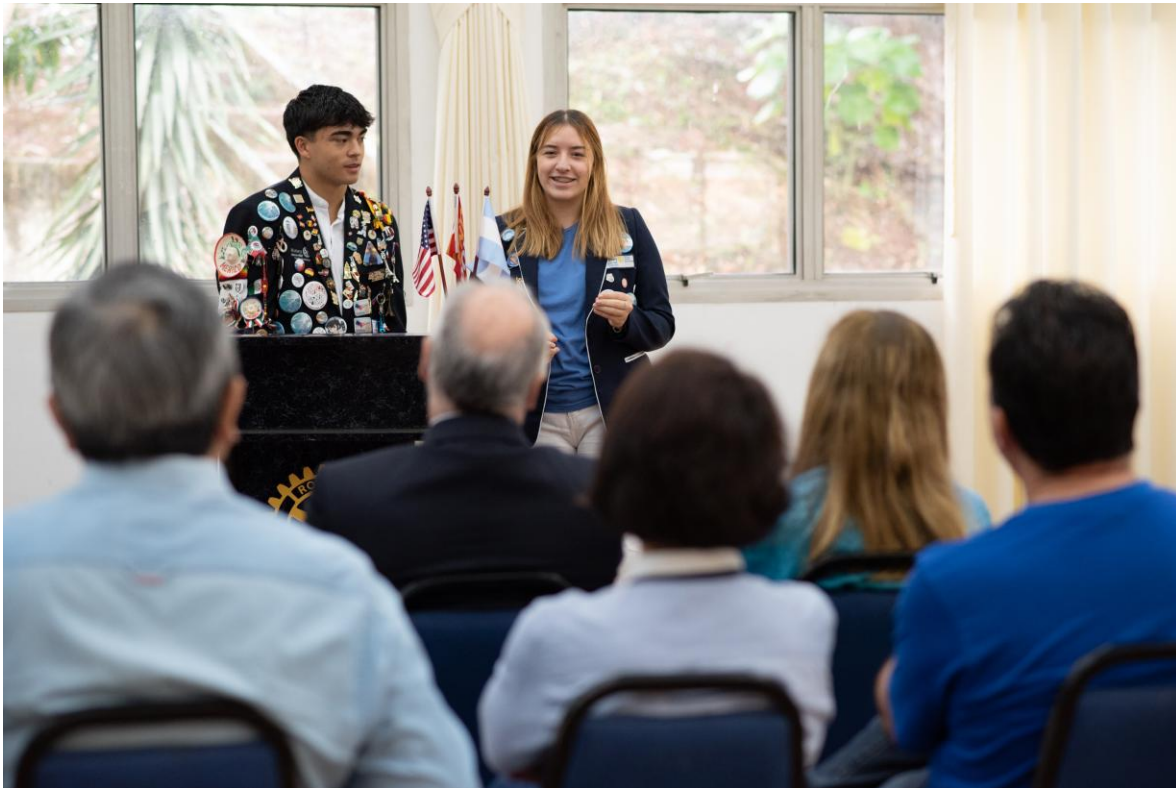
相手先のロータリークラブ例会で卓話