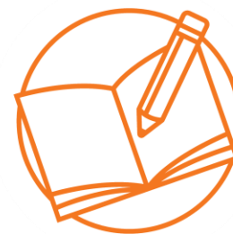
基本的教育と識字率向上