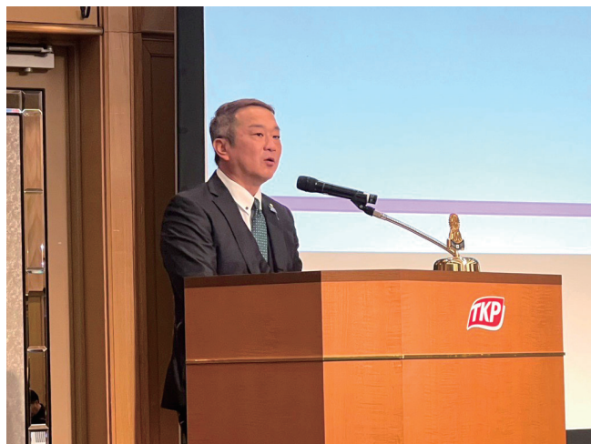
地区管理運営統括セミナー 挨拶