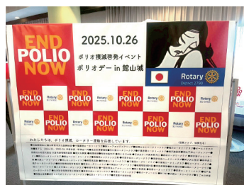
地区八犬伝プロジェクトでもロータリーポリオプラス委員会が全面協力