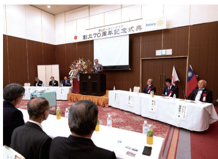
創立 70 周年記念式典の様子

私たちはこの節目にあたり、「これまで」と「これから」に寄り添いながら、より一層意義ある活動を続けてまいります。今後とも変わらぬご指導ご鞭撻を賜りますようお願い申し上げます。