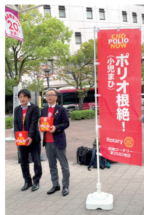
第 2580 地区 (東京) 世界ポリオデー in えどがわのイベントにて