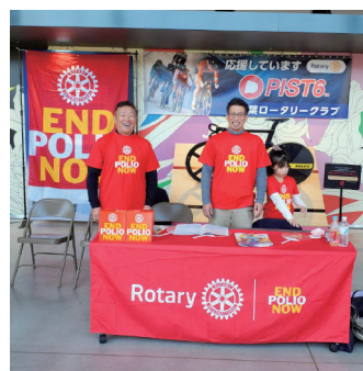
千葉コネクタ衛星ロータリークラブ & 千葉ロータリークラブ共同事業 アーバンスポーツ 3×3バスケットボールのイベントに地区よりポリオブースの出店応援 (千葉チップスタードームにて)