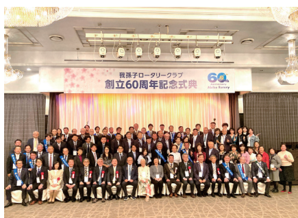
記念式典集合写真

我孫子ロータリークラブは今後もロータリー精神に基づく奉仕活動をさらに実践して行きながら、改めて地域社会における存在意義を高め、社会貢献できるよう努めてまいります事をお約束して 60 周年記念事業報告とさせていただきます。