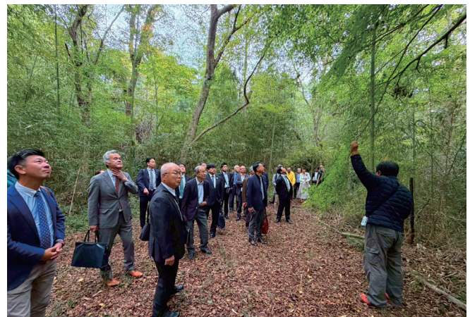
社会奉仕セミナー