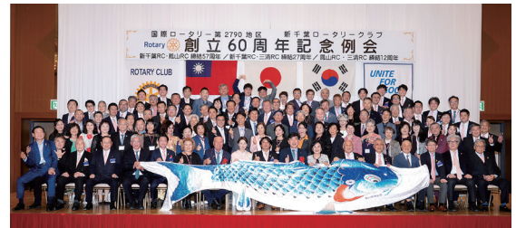
姉妹クラブの鳳山 RC・ソウル三清 RC と記念撮影