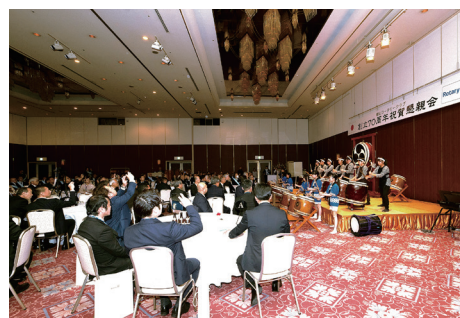
創立 70 周年祝賀会の様子