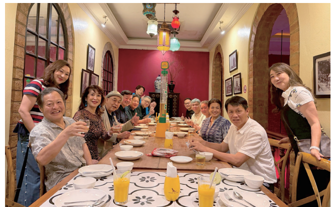
職業奉仕ラオスVTT締結式

ロータリー財団統括委員会との地区補助金合同審査会を以て今年度の事業を無事終了することができました。関係各位の皆様に感謝申し上げます。