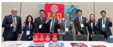
地区大会 友愛の広場にて