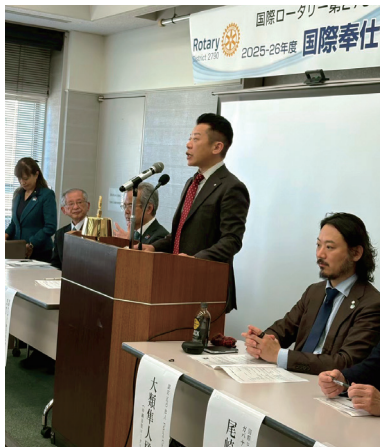
国際奉仕セミナー